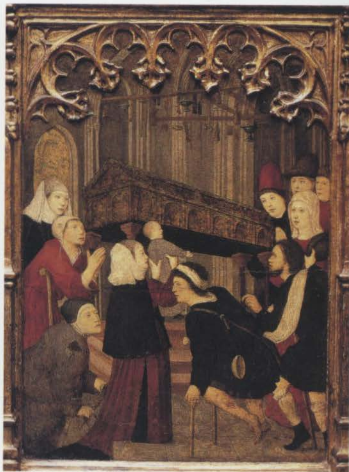
Antoine de Lonhy, taula de la Mort de santa Mònica de la predel·la del Retaule de la Mare de Déu , sant Agusti i sant Nicolau de Tolentino. Museu del Castell de Peralada.